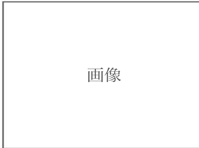
14世紀に描かれたイタリアの田園風景

A 人類にとって森は、食料や建材など生活物資の供給源であると同時に、神話や民間伝承の源泉でもあった。しかし、人類の歴史はその森の破壊の歴史でもある。西欧では、中世盛期に、① 農業技術の改良 によって大開墾運動が進み、都市住民を養うために周辺の森が伐採された(下図参照)。中世末期には、② 戦乱と疫病と飢饉のため人口が減少し、森は少し回復したが、その後、鉱業用燃料・船材の必要や人口増加から、森が大規模に開発されるようになる。 ③ 19世紀以降、さらに森の伐採が進むとともに、急速な都市化・工業化などによって大気と水の汚染が広まり、結核やコレラなどの病気も流行した。