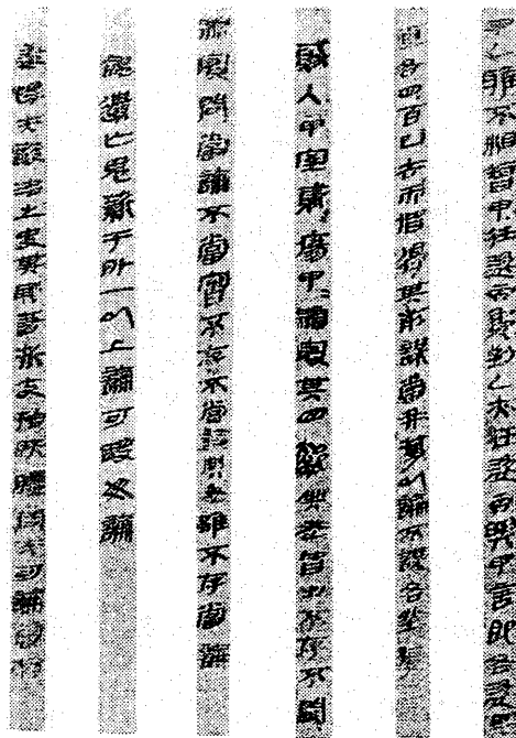
秦の始皇帝時代の法律について記された竹簡

A ① 世界各地の古代文明では、様々な形式を持つ法が多様な状況の中で生み出された。 例えば中国では、② 春秋戦国時代から秦漢時代にかけて 、社会的な行動規範である「礼」とともに、「律」や「令」と呼ばれる法が成立してくる。刑法としての律と行政法としての令の区分は、晋(西晋)の泰始律令 たいし で確立したが、さらにその後の補足的法規定が格・式として整備され、隋に至って律・令・格・式からなる法体系が成立した。③ 隋、そしてそれを継いだ唐の律令制は 、朝鮮や日本などの東アジア諸地域に伝えられ、それぞれの地域での国家形成に大きな役割を果たすことになる。